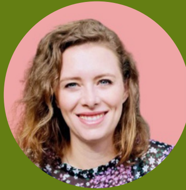
KRISTEN HIGH SCHOOL PROGRAM COORDINATOR AUSTRALIA