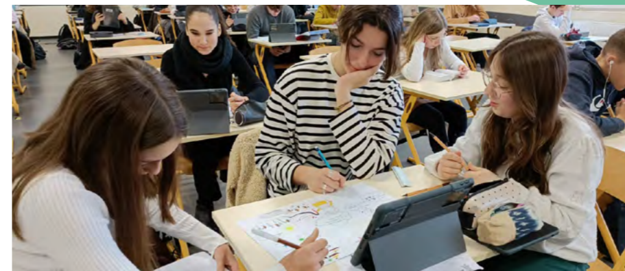
Erasmus+ Enrichit les vies, ouvre les esprits.